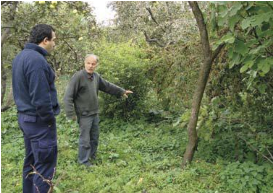
2008 წლის ოქტომბერი. სოფელ ტყვიავის მკვიდრი უხსნის ადამიანის უფლებათა ცენტრის მკვლევარს, თუ როგორ მოახერხა ოსი შეიარაღებული პირების მიერ მის სახლზე მიტანილი იერიშისას თავის დაღწევა.

შესახებ), ასევე მოითხოვეს ინფორმაცია აგვისტოს მოვლენების დროს სავარაუდოდ ჩადენილ დანაშაულებზე მიმდინარე გამოძიების პროცესის შესახებ. მთავარი პროკურატურის წერილი, დათარიღებული 2009 წლის 18 მარტით, აცხადებს რომ მთავარი პროკურატურა აწარმოებს გამოძიებას 2008 წლის აგვისტოს ომის დროს ჩადენილ დანაშაულებებზე; უფრო კონკრეტულად კი იმ დანაშაულებზე რომელიც განხილულია საქართველოს სისხლის სამართლის კოდექსის 407-ე (გენოციდი), 411-ე (საერთაშორისო ჰუმანიტარული სამართლის ნორმების განზრახ დარღვევა შეიარაღებული კონფლიქტის დროს), და 413-ე (საერთაშორისო ჰუმანიტარული სამართლის ნორმების სხვა დარღვევები) მუხლებით.