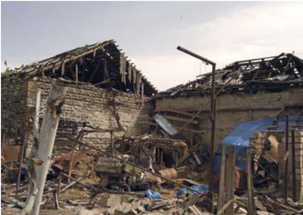
ქართული სოფელი ტყვიავი: 2008 წლის აგვისტოს ომის დროს ავიადარტყმის შედეგად განადგურებული საცხოვრებელი სახლი.

იმის გათვალისწინებით რომ ამ 244 მოსარჩელედან ალბათ ყველა მსხვერპლი არაა, მაგრამ მძიმე დანაშაულის თვითმხილველები არიან, და მათ შესაძლოა საჭირო ინფორმაცია ჰქონდეთ დამნაშავეებთან დაკავშირებით როგორც რუსული ასევე ოსური სამხედრო სარდლობის, ჯარისკაცების და სამხედრო სტრუქტურების მხრიდან, ის ფაქტი რომ მათი მხოლოდ 13%-ია (ყოფილი ტყვეების გარდა)