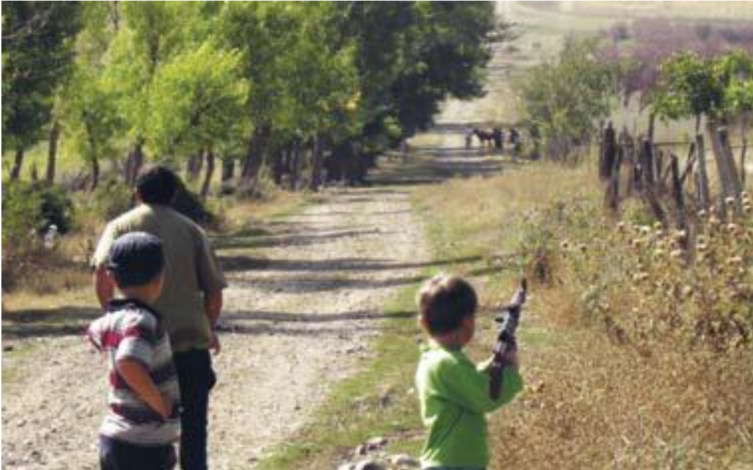
2008 წლის სექტემბერი. რუსი სამხედროების გამშვები პუნქტი რუსეთის არმიის მიერ დადგენილ ეგრეთწოდებულ ბუფერულ ზონაში მდებარე სოფელ ალიში.

მოგვიანებით, საქართველოს ხელისუფლების წარმომადგენლები შეხვდნენ პროკურატურის მართლმსაჯულების, შეკრებადობისა და თანამშრომლობის განყოფილების წარმომადგენლებს და შესთავაზეს ინფორმაციის გაცვლა და თანამშრომლობა.