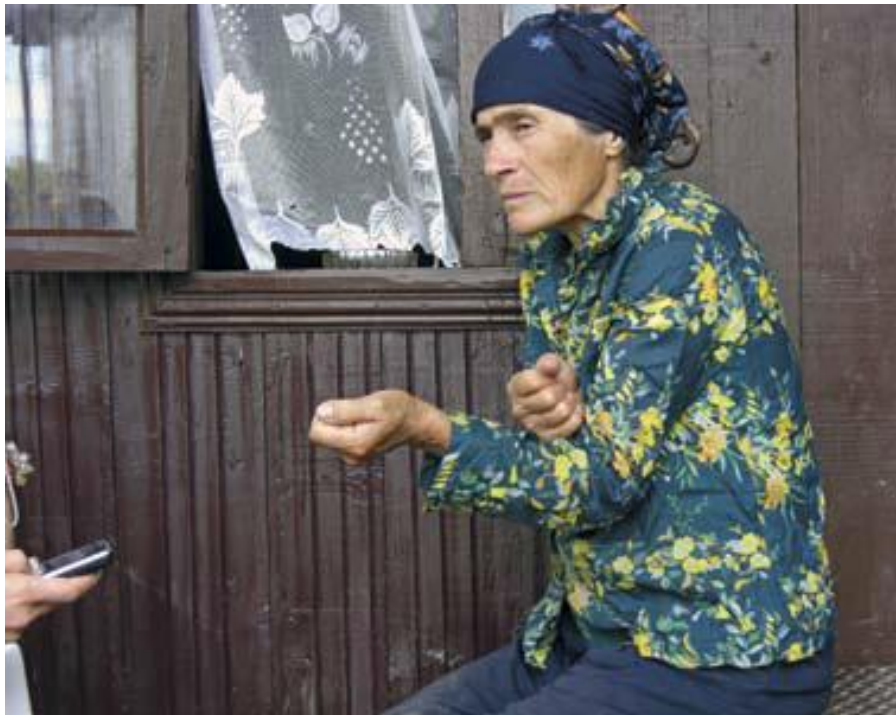
2008 წლის სექტემბერი. ქალბატონი აფხაზეთის დე-ფაქტო საზღვართან მდებარე ქართულ სოფელ განმუხურიდან ყვება თუ როგორ აიძულეს იგი შეიარაღებულმა პირებმა, დეტოვებინა საკუთარი საცხოვრებელი ადგილი

საქართველოს სისხლის სამართლის კოდექსის მე-4 მუხლით „საქართველოს ტერიტორიაზე ჩადენილად ითვლება დანაშაული, რომელიც დაიწყო, გრძელდებოდა, შეწყდა ან დამთავრდა საქართველოს ტერიტორიაზე“.